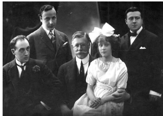
Miguel Llobet, Emilio Pujol, Juan Carlos Anido, Maria Luisa Anido et Domingo Prat chez les Anido en 1919.

En 1919, Miguel Llobet réside toujours chez les Anido en Argentine, d'où il continue ses activités de concertiste et de professeur.