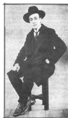
Llobet à New-York, 1916

Le 29 octobre 1912, à son retour d'Amérique du Sud vers Paris, Llobet fait une halte à New York pour quelques jours (s1).