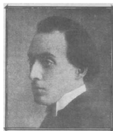
Llobet a Parigi, 1905 (s11)