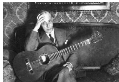
11. Miguel Llobet