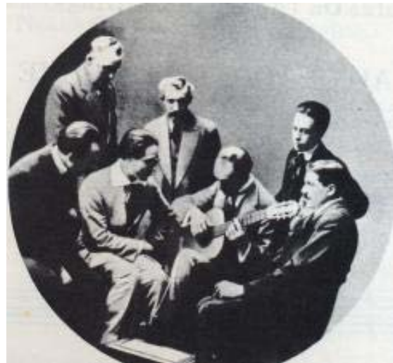
Segovia devant Llobet à la guitare. Date inconnue, vers 1916.

Mais on ne possède pas de source fiable (s7) selon laquelle Andrés Segovia aurait été un élève régulier de Miguel Llobet.