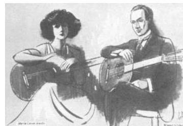
12. Maria Luisa Anido and Miguel Llobet.