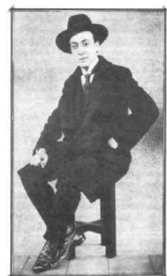
Llobet, New-York, 1916

On October 29, 1912, on his return from South America back to Paris, Llobet made a stop in New York for several days (s1) .