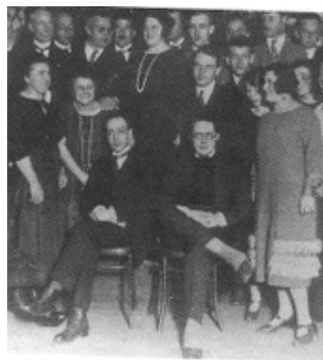
6. Llobet et Segovia after a concert at the « Munich Guitar (s15) Society » in July 1915. The man with a moustache at the back standing above Llobet is Hermann Hauser, a famous Munich guitar maker.