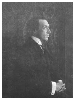
3. Miguel Llobet. According to a picture extracted from number 17 of the "Mundial Magazine" dated September 1912.