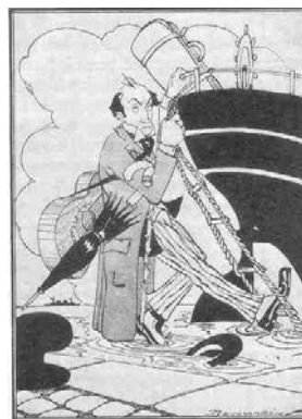
Llobet rattrape son bateau de justesse à Cadiz. Dessin de Bensadon.

Cependant, Miguel Llobet quitte régulièrement son poste avancé d'Argentine pour effectuer des tournées en Amérique du Nord et Centrale, au Brésil, dans les Caraïbes et sillonner pratiquement toutes les grandes villes d'Europe occidentale.