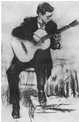
Miguel Llobet in concert.

Miguel Llobet gave his first concert outside of Spain in Paris in 1904, presented by his friend and compatriot, Ricardo Viñes, the celebrated pianist and interpreter of the works of Debussy. 5