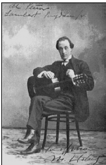
7. Miguel Llobet.