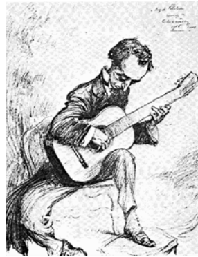
Miguel Llobet dibujado por Charles Léandre. Mercure Musicale, 1906.

En aquella época frecuenta compositores parisienses como Paul Dukas, Claude Debussy 6 , Maurice Ravel, Isaac Albéniz 7 y Manuel de Falla.