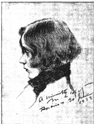
1. Maria Luisa Anido. Drawing by Miguel Llobet.