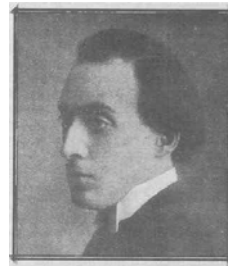
Llobet en París, 1905 (s11)