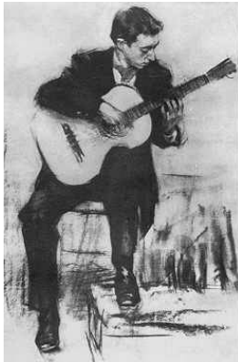
Miguel Llobet in concerto. Fonte sconosciuta.

Miguel Llobet dà il suo primo concerto fuori dalla Spagna a Parigi nel 1904, presentato dal suo amico e compatriota Ricardo Viñes, il celebre pianista interprete delle opere di Debussy 4 .