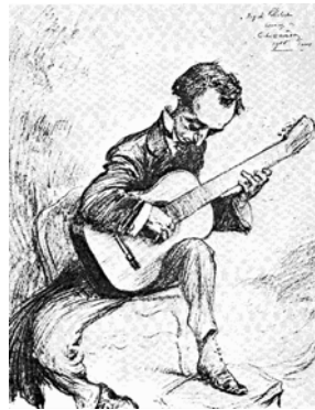
Miguel Llobet sketched by Charles Léandre. Mercure Musicale , 1906.

During this period, he associated with such Parisian composers as Paul Dukas, Claude Debussy 6 , Maurice Ravel, Isaac Albéniz 7 and Manuel de Falla.