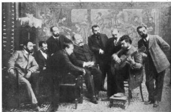
A sinistra, Miguel Llobet di fronte a Francisco Tárrega.