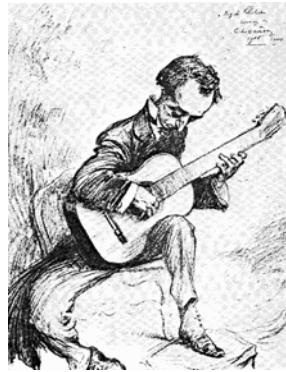
Miguel Llobet disegnato da Charles Léandre. Mercure Musicale, 1906.

A quell'epoca frequentava compositori parigini come Paul Dukas, Claude Debussy 5 , Maurice Ravel, Isaac Albéniz 6 e Manuel de Falla.