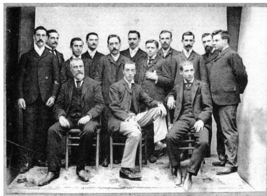
La sociedad musical Lira Orfeo.

Parece estar demostrado que, desde 1898, Miguel Llobet creó en Barcelona la sociedad musical "Lira Orfeo", que reunía un grupo de aficionados.