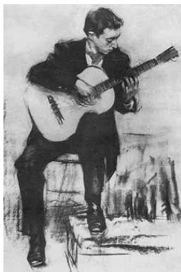
Miguel Llobet en concert.

Miguel Llobet donne son premier concert hors d'Espagne à Paris en 1904, présenté par son ami et compatriote Ricardo Viñes, le célèbre pianiste interprète des œuvres de Debussy 5 .