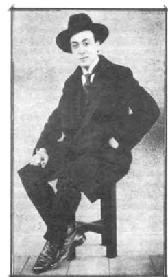
Llobet a New-York, 1916 da Suydam.

Il 29 ottobre 1912, al suo ritorno a Parigi dall'America del Sud, Llobet si ferma a New York per qualche giorno (s1) .