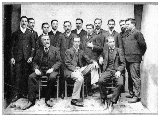
La société musicale Lira Orfeo.

Il semble établi que dès 1898, Miguel Llobet avait crée à Barcelone la société musicale « Lira Orfeo », qui réunissait un groupe d'amateurs.