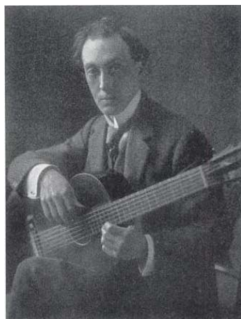
5. Miguel Llobet with his Torres FE-09 guitar (s9) acquired in 1916. Postcard printed in Munich.