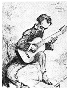
Miguel Llobet dessiné par Charles Léandre. Mercure Musicale, 1906.

A cette époque il fréquente des compositeurs parisiens tels que Paul Dukas, Claude Debussy 6 , Maurice Ravel, Isaac Albéniz 7 et Manuel de Falla.