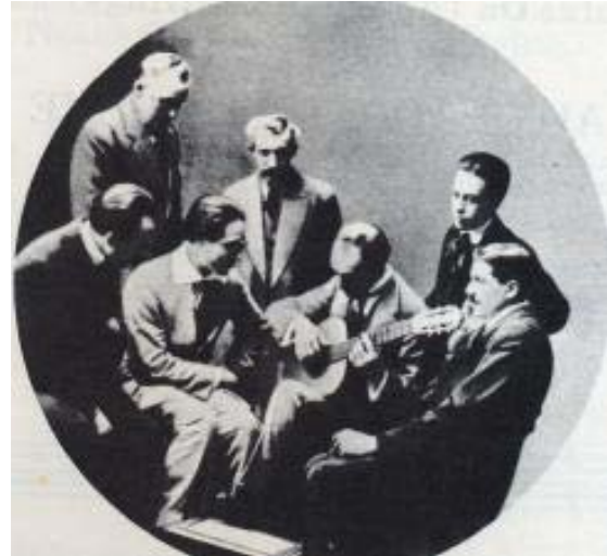
Segovia in front of Llobet playing the guitar. Unknown date, approx. 1916.

But we do not possess viable documentation proving that Segovia was a regular pupil of Miguel Llobet (s7) .