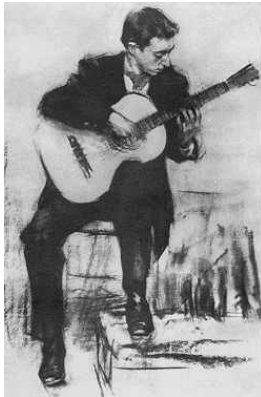
Miguel Llobet en concierto. Origen desconocido.

Miguel Llobet da su primer concierto fuera de España en París en 1904, presentado por su amigo y compatriota Ricardo Viñes, famoso pianista intérprete de las obras de Debussy 5 .