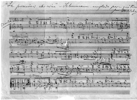
Manoscritto dell'arrangiamento di un brano di Robert Schumann. (Album pour la Jeunesse, Opus 68 n°16)

L'ispirazione delle tredici Canzoni Catalanes 14 , tutte di una bella fattura melodica e armonica, varia dalla semplicità per « la filla del marxant » o per « la pastorella » alla grande densità per « el mestre ».