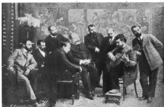
A gauche, Miguel Llobet face à Francisco Tárrega.