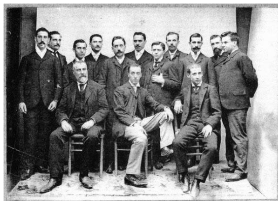
The music society Lira Orfeo.

It has been recognized that in 1898, Miguel Llobet had created in Barcelona the musical society, "Lira Orfeo", which brought together a group of amateurs.