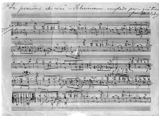
Manuscript of the arrangement of a Robert Schumann's piece. (Album pour la Jeunesse, Opus 68 n°16)

The inspiration for the thirteen Catalan Folk Songs 15 , all lovely melodic and harmonic compositions, varies from the simplicity of La Filla del Marxant or of La Pastoreta to the great complexity of El Mestre.