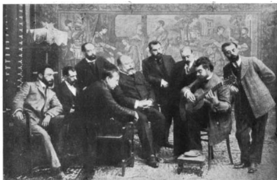
Miguel Llobet on left facing Francisco Tárrega.