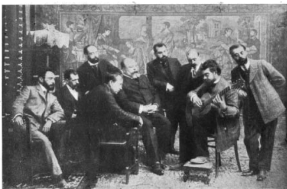
A la izquierda, Miguel Llobet frente a Francisco Tárrega.